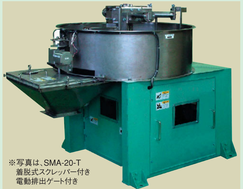
※写真は、SMA-20-T 着脱式スクレッパー付き 電動排出ゲート付き

チョッパーを装備することで、今までにない短時間での精密混合・精密混練ができます。