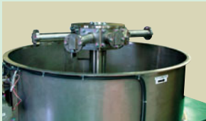
アームを取り外した状態