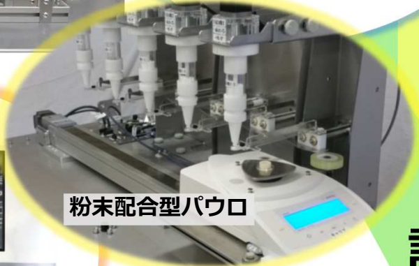
粉末配合型パウロ