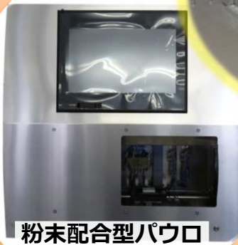
粉末配合型パウロ