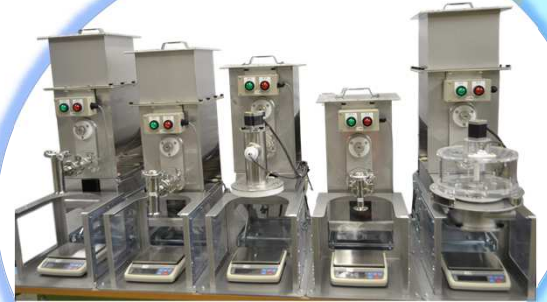
同時計量型パウロ